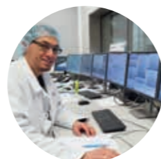
Mise en service